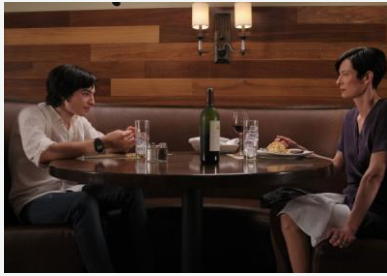
Commenter la scène dont est tirée cette prise de vue (Ezra Miller et Tilda Swinton)