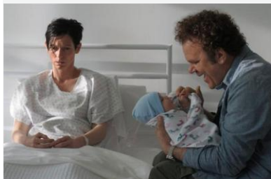
Eva (Tilda Swinton) et Franklin (John C. Reilly) à la maternité