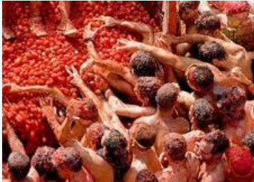
Fête de la Tomatina à Bunol (Espagne)