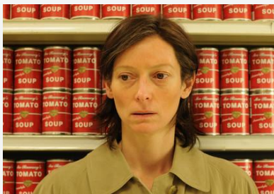
Eva se cachant de la mère d'une des victimes de Kevin, dans un supermarché, derrière un rayon de boîtes de soupe à la tomate!