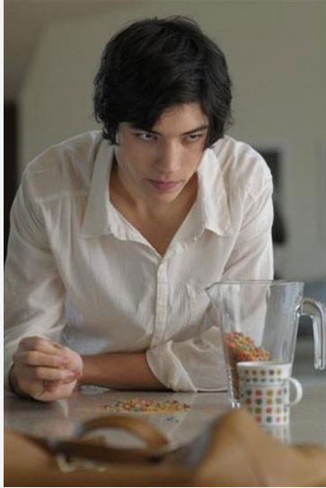
Kevin, dans sa seizième année (Ezra Miller)