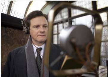
Le roi (Colin Firth) ne s'entend pas lire le monologue de Hamlet "To be or not to be"