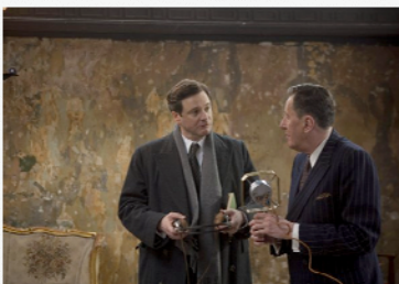
Bertie (Colin Firth) et Lionel (Geoffrey Rush) dans le domicile de ce dernier