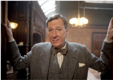
La résidence - cabinet de consultation de Lionel Logue (Geoffrey Rush)