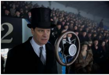
Le prince Albert (Colin Firth), lors du catastrophique discours de Wembley