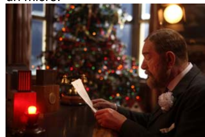
George V (Michael Gambon) prononce son message de Noël

Tandis que David s'en tirait bien, seul Bertie, comme on le constate dans la scène liminaire du film, lors du discours de clôture de l'Exposition de l'Empire britannique ( British Empire Exhibition ) à Wembley en 1924, était une vraie catastrophe. Bertie butant sur presque chaque mot de son texte dactylographié, son père impatient se fâchait de plus en plus, accusant son fils de mauvaise volonté.