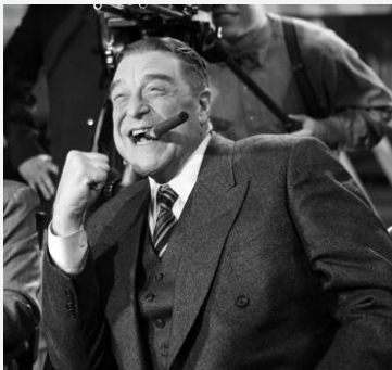
Le Producteur Zimmer (John Goodman)

Quelques autres premiers rôles, tenus par des Américains :