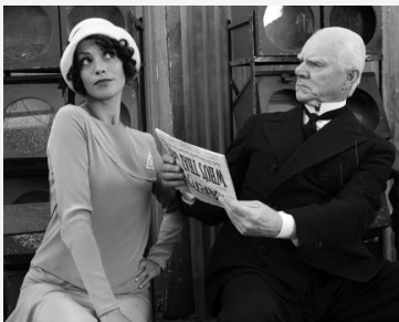
Un très digne monsieur assis dans les studios compare la photo du journal ("Who's that Girl?") à Peppy (Malcolm MacDowell)