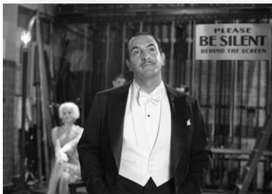
George Valentin (Jean Dujardin) contemplant son image sur l'écran