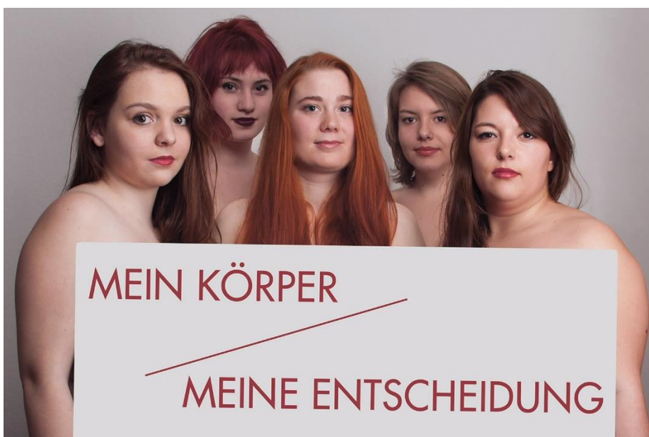
"Mon corps / mon choix"