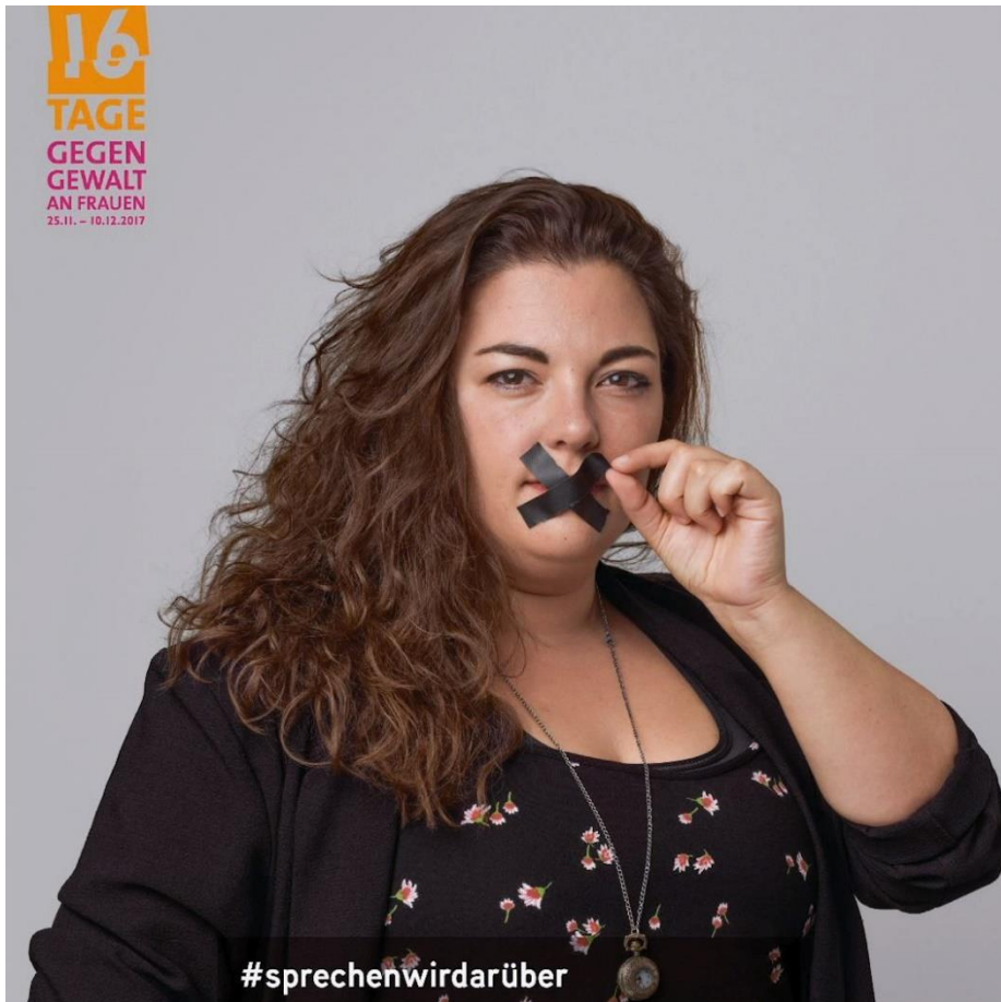
Campagne "16 jours contre la violence faite aux femmes" #onenparle