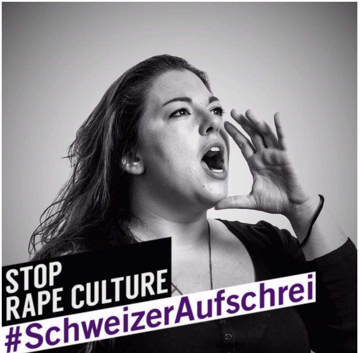
Stop à la culture du viol #tollésuisse